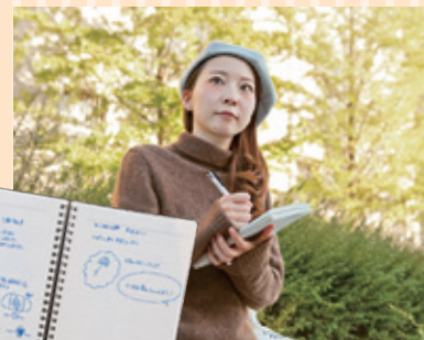
常に「アイデア帳」を持ち歩き、アイデアが思いついたらすぐにノートを取る関さん。将来は雑貨屋やインテリアショップで働きたいと話す。

2010年 15歳 中学3年生のときにアナログレコードを使った壁掛け時計を作り、周りから好評を得る